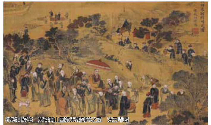
禅統真紹筆 黄檗開山国師来朝到岸之図 法田寺蔵

初公開となる唐寺の宝など、長崎と関わりが深い隠元禅師によって伝えられた黄檗文化を紹介します。