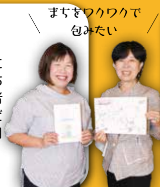
まちをワクワクで包みたい

平和町周辺の活性化を目的にしたまちづくりの会社で、まち歩きワークショップや旅行者向け平和町ガイドブックなどを手掛けました。今年の7月にはシェアキッチン(※)「くるねこんね」をオープン！