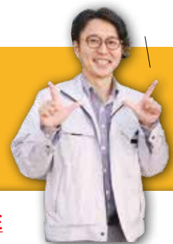
出島表門橋で会いましょう

出島表門橋架橋の設計チームが中心の市民団体で、「長崎、出島を盛り上げたい。出島表門橋に愛着を持って欲しい」という思いで、月に2回「はしふき」を実施中。また、出島表門橋公園の利活用のサポートもしています。