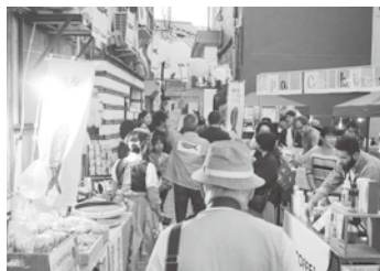
銅座路地裏ナイトマルシェ・路地裏で乾杯!