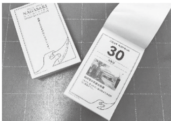
まちなか 365 日卓上日めくりカレンダーによるワクワクドキドキ発見