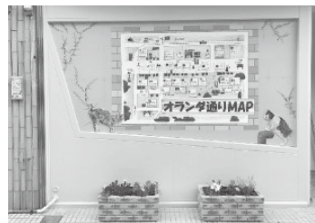
「オランダ通りで一日を」～長崎の歴史と人と店をつなぐ楽しみ方～