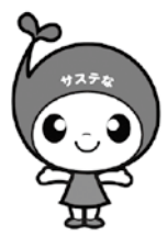
サステなっちゃん