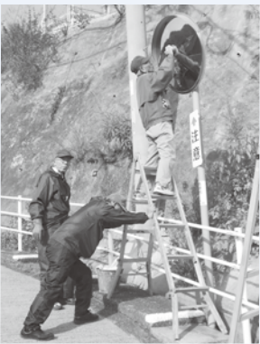
カーブミラーの清掃活動