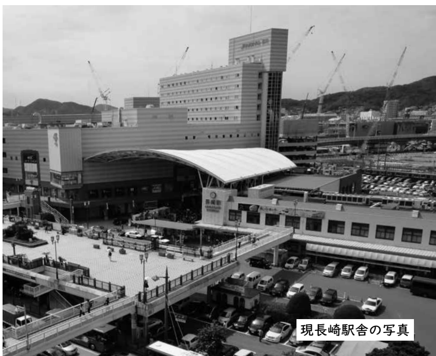
現長崎駅舎の写真

新長崎駅舎の開業や新駅ビル建設、新幹線の開通、出島メッセ長崎の開業など、今、長崎駅の周辺は大きく風景が変わろうとしています。これからの時代に合わせて進化し、新たなにぎわいをつくるために、整備を進めているからです。 今回は、その「陸の玄関口」である長崎駅周辺がどんな風に生まれ変わっていくのか紹介します。