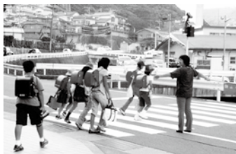
登下校の見守りも行っています

今年度は婦人部でヨガやフラワーアレンジメント教室を実施したところ、大変好評で、会員同士の交流を深めるよい機会になりました。 地道な取り組みですが、楽しみながら活動を行うこと、その時のニーズに合った活動を行うことが大事だと思います。 高齢者世帯も増えてきていますので今後は見守り活動なども考えていきたいです。