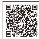
臨時福祉給付金QRコード