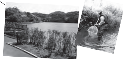
川原大池公園内の動物や植物の実態を調査しています