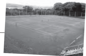
香焼総合公園の施設を整備しています