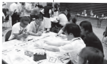
野母崎エリアの未来を考えるワークショップを開催しています