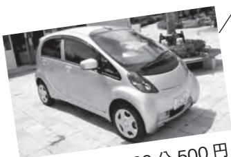
電気自動車を30分500円で貸し出しています