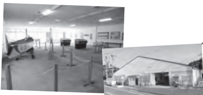
伊王島地区活性化交流拠点施設を整備しました