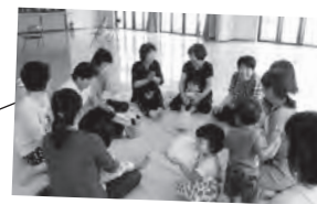
市民が主体となって異世代の交流や健康づくりに取り組んでいます