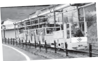
トロックに乗って坑内体験ができます