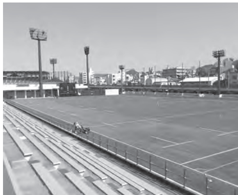
▲国体開催に合わせ、人工芝に整備された市営ラグビー・サッカー場

答 誘致に向けては、大会や合宿等での施設の利用について、一般の利用者より優先して申し込めるよう基準の見直しを行った。また、会場については長崎国体の開催をきっかけに施設が整備されたため、全国大会から一般利用まで、十分に対応可能と考えている。平日昼間の時間帯は「空き」があるため、今後は合宿の誘致について庁内で協議を行っていききたい。なお、中部下水処理場の廃止については平成35年度を目標としている。