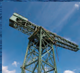
ジャイアント・カンチレバークレーン