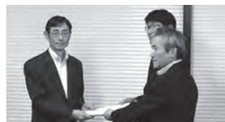
▲7月に行った要望活動の様子

答 これまでも、国への要望を重ねてきたが、「科学的・合理的根拠を示さなければならぬこと」が常に高いハードルとなってきた。未だ、それは見い出せていないが、高齢化し、苦しんでいる被爆体験者の援護の充実が喫緊の課題となる中、今年度は「救済」の観点から国に対し新たな要望を行う必要があると判断した。節目の年にあたり、踏み込んだ方策が講じられるよう努力したい。