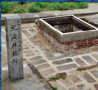
高島炭坑(北溪井坑跡)