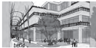
▲長崎浜市まちづくり構想 (※このイメージ図は、構想の段階で作成されたものであり、地権者などの同意を得たものではありません。)

答 現在、浜町地区では「長崎浜市まちづくり構想」に基づく取り組みをさらに具体的に進めるため、「浜町地区市街地再開発準備組合」が設立され、再整備に向け積極的な検討が進められている。今年度は国と市の支援により、再開発事業に関する推進計画の策定に取り進むこととされている。本市としては、事業の進展に合わせ、必要となる計画策定への助言や事業費の助成など、継続的な支援を行うとともに、関係部局と連携し、サポートしたいと考えている。