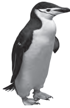
▲新しい仲間!! ヒゲペンギン!

は、明治日本の産業革命遺産の世界遺産登録への期待が高まっている年であり、制定するよい機会であると考えている。市民の皆様が親しまれ、愛着を感じてもらうことが重要であるため、アンケート調査を実施するなど準備を進めたい。