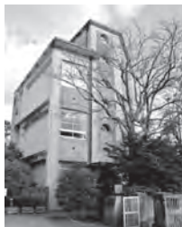
▲城山小学校被爆校舎 ▲進んでいる。

答 被爆4遺構は、原子爆弾の凄まじさを伝える貴重な遺構であり、末永く後世に継承するため、指定文化財化への取り組みを進めており、市長も文化庁長官へ協力要請を行った。また、パグウォッシュ会議では、遺構見学のための「モデルコース案内」を作成しているほか、ガイド等も含め、関係機関と連携して準備を進めている。