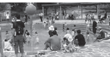
▲噴水のある池。子どもたちに大人気

答 あぐりの丘は、平成10年7月に民間企業により開園し、民間企業が撤退した平成18年4月から、市が運営・維持管理を行っている。完全民営化は困難と考えるが、民間のノウハウを活用できる指定管理者制度の導入について検討を進めたい。