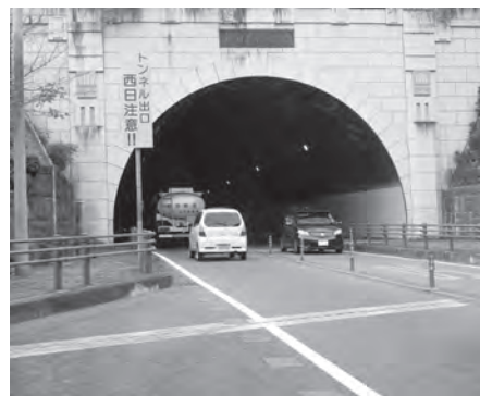
▲現在、2車線の新日見トンネル付近。4車線化早期実現に向けて要望活動を行っている。

答 九州横断自動車道の4車線化については、交流人口の拡大を図るうえで必要不可欠と考えており、未着工と