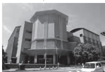
▲長崎ブリックホール

委員会では、ブリックホールであるゆるニーズに応えなければならぬため、市民の意見を酌んでより使いやすい施設にしてほしいとの賛成意見が出され、異議なく原案を可決しました。