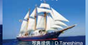
ナジェジュダ (ロシア)