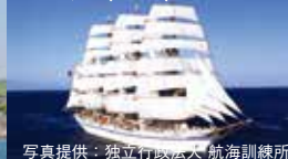
ドントレッダー (日本)