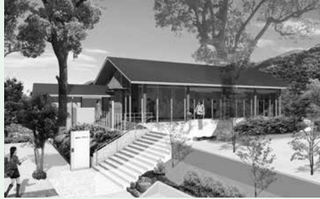
淵神社待合所完成イメージ

※代替手段など詳しくは、市ホームページ(「長崎ロープウェイ 運休」で検索)をご覧ください。