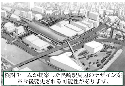
検討チームが提案した長崎駅周辺のデザイン案 ※今後変更される可能性があります。