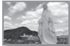
海の上に立つマリア像と神ノ島教会