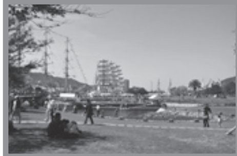
長崎水辺の森公園 ポイント 市民に親しまれている緑にあふれる公園。昼だけでなく、夜の光の演出もすばらしい。