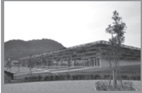
ANAテレマート株式会社長崎支店 ポイント 緑化に取り組み、働く人・見る人に“やすらぎ”を与えてくれる開放的な建物。