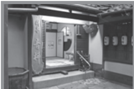
料亭 青柳 ポイント 緑に覆われた石垣と建物が一体となった風情ある景観が、花街丸山の情緒を伝えている。