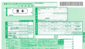
家電リサイクル券(見本)