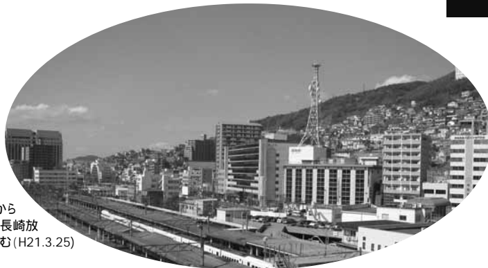
写真：駅構内から 西坂公園(NHK長崎放 送局)方向を望む(H21.3.25)