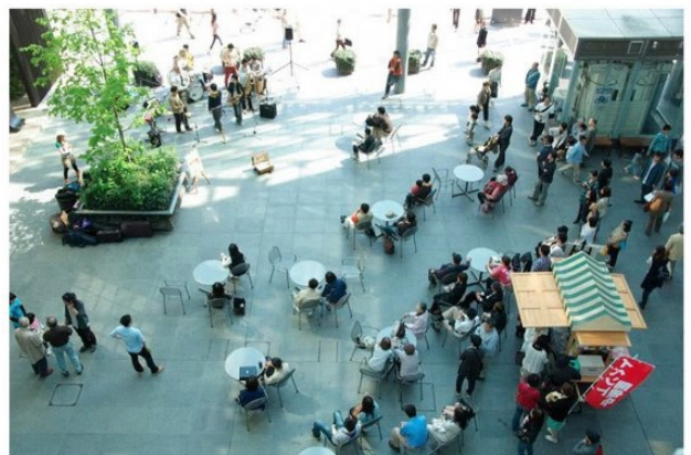
▲富山市まちなか賑わい広場グランドプラザ（富山県）②