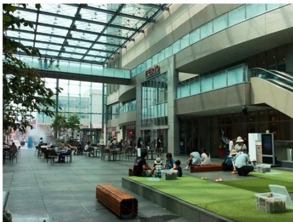
▲富山市まちなか賑わい広場グランドプラザ（富山県）