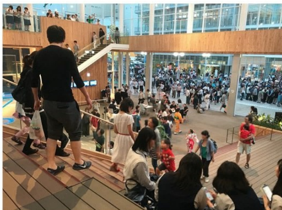
▲八戸まちなか広場マチニワ（青森県）