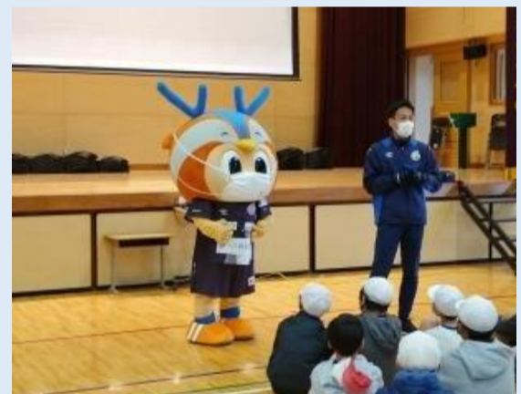
6年生対象のサッカー体験教室