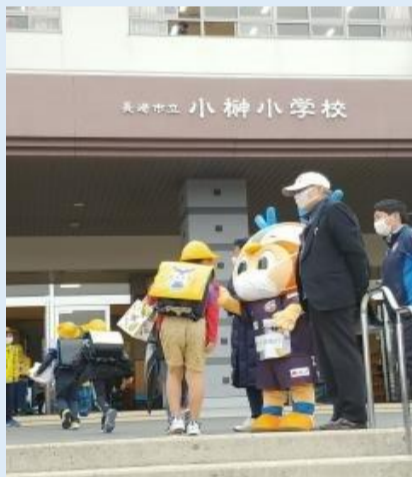
ヴィヴィ君 登校児童の出迎え

3月9日（火）にV・ファーレン長崎を地域ぐるみで応援する機運を醸成し、地域の一体感を高めるため、地域とV・ファーレン長崎をつなぐ事業「V・ファーレン長崎協働事業」の一環で、ヴィヴィくんの朝のあいさつ運動、V・ファーレン長崎のスタッフによるサッカー体験教室や夢について考えるトークの時間等が小榊小学校で開催されました。