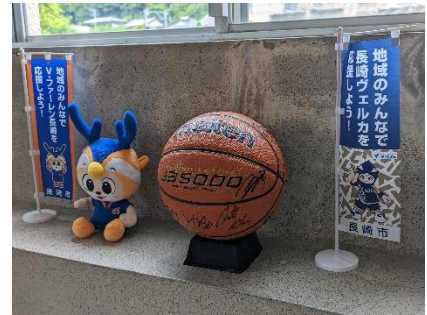
▲長崎ヴェルカのサイン入りボールを飾っています。

コロナ禍により「自粛」という冬ごもりをしていた学習グループが一斉に動きだしました。まだ感染者数は高止まりのままですがさらに感染防止対策を推し進めてマンパワーで乗り越えて行きましょう！