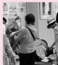
長崎の女性団体によるバザー

また、会場には、「STOP! 暴力」等の、女性に対する暴力根絶の思いが込められたTシャツや、男女の賃金格差について訴える記事を展示しました。