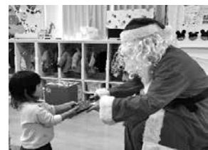
事業所内託児所「ぎんやキッズ」クリスマス会の様子

職員のみ利用可能な事業所内託児所「ぎんやキッズ」を設置し、0歳3か月から就学前のお子さんを預けることができる。(365日開園)