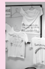
展示「私の気持ちをTシャツに」

また、会場には、「STOP! 暴力」等の、女性に対する暴力根絶の思いが込められたTシャツや、男女の賃金格差について訴える記事を展示しました。