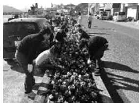
社員による花植整備活動の様子 (ボランティア)

安全衛生委員会を各部署に配置し、職場環境改善や残業時間管理等を行い、残業超過者に対して有給勧奨を行うなど、社員の健康管理に努めている。