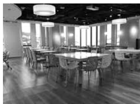
マッサージチェア付きのカフェテリア (休憩室)

女性の管理職候補者を育成するためのプログラム、FTP (Female Talent Program) を通して、女性の人材育成に取り組んでいる。