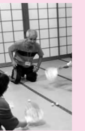
体験講座「パパもママも遊び上手になろう!」

体験講座「パパもママも遊び上手になろう!」では、身近にある物を利用したアイデア満載の遊び体験に、父親・母親関係なく、多くの親子が盛り上がりました。