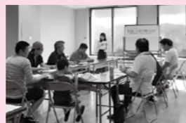
講座「男性諸君!なぜ妻が不機嫌になるのか〜お悩み解決のヒントを探してみませんか〜」

10月5日は、長崎の女性団体によるバザーや男女共同参画に関する様々な講座が行われました。 講座「男性諸君!なぜ妻が不機嫌になるのか〜お悩み解決のヒントを探してみませんか〜」では、「家事は手伝うものではなく、シェアするものであること」等を学びました。