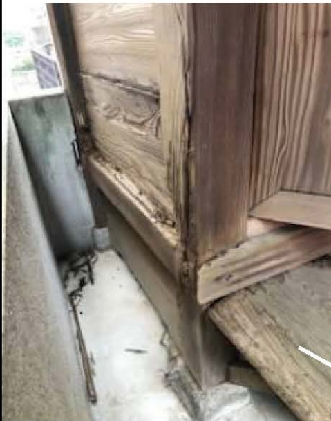
社殿左側の板塀。下半分はシロアリに侵食されています。

今回は事情ご賢察の上、例大祭費用を含め、一口2千円以上のご芳志を伏してお願い申し上げる次第です。以下の写真は現状の姿です。