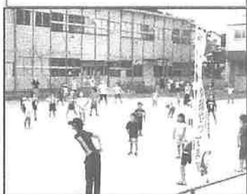
合同ラジオ体操風景

最後に、毎年スタンプ押しなど、ご協力頂いている [黒] 有竹とんぼをプレゼントして頂く [黒] 有難うございました。