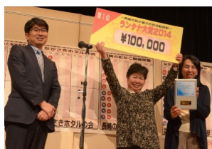
▲昨年の表彰式の様子