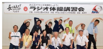
▲今年度活動中の「わが町公園de元気塾」

現在、平成28年度に活動する「塾」の塾長とテーマを募集しています。長崎のまちをもっと元気にするためのユニークなアイデアをお待ちしています。