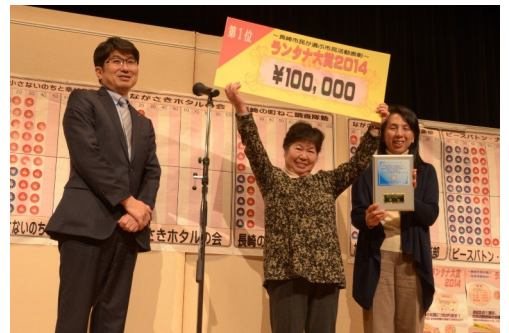
▲「ランタナ大賞2014」表彰式の様子

募集要項やエントリーシート（応募書類）は、ホームページ「ながさき市民力ネット」からもご覧いただけます。