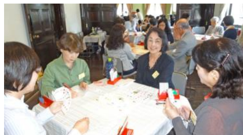
26年度「コントラクトブリッジ塾」

長崎伝習所の「塾」は、長崎のまちづくりにつながる様々なテーマについて、塾長と、趣旨に共感して集まった塾生の皆さんが、自由な発想と創意工夫で調査・研究を行うものです。