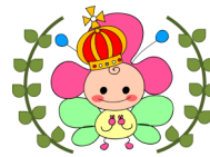
市民活動センターの マスコットキャラクター 「ランタナちゃん」 ランタナ大賞バージョン