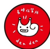
長崎伝習所マスコットキャラクター「den den」

現在、前売券を発売中です。前売券は全6回分で4,000円と大変お買い得となっています。ぜひお買い求めください。