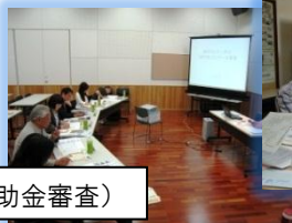
審査部会(補助金審査)