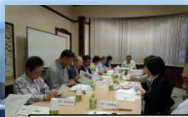
市民力推進委員会

市民力や市民協働の推進に係る各種施策についての助言や提案、また、市民活動支援補助金及び市民活動に係る公募事業の審査・評価等を行う。(年6回程度)。