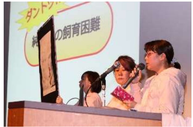
長崎 Life of Animal