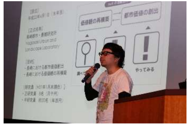
長崎都市・景観研究所/null