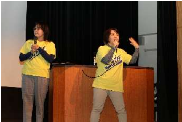
YA 長崎サポーターズ