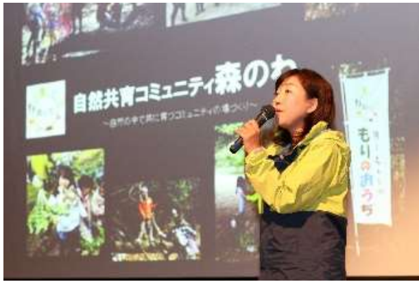
自然共育コミュニティ 森のわ