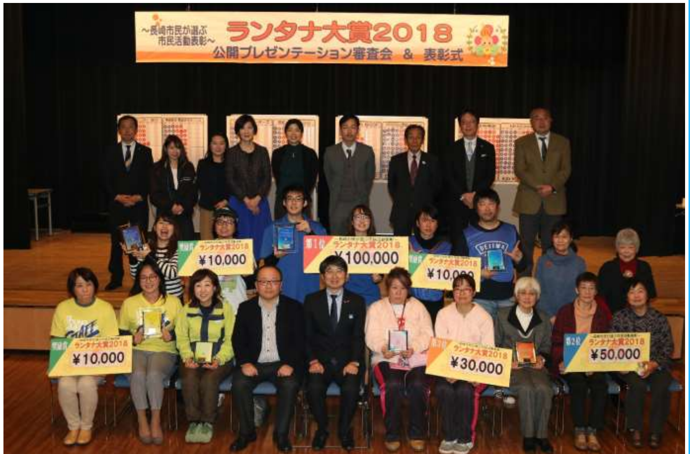
3位 長崎 Life of Animal