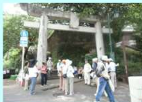
植物観察・採集会及び史跡探訪