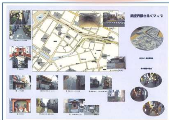
「銅座界限さるくマップ」の制作

長崎市が進める銅座川の暗渠解消プロジェクトにあわせ、川沿いが市民や観光客が楽しく行き交う水辺になることを夢見て、様々な提案や活動を続けています。