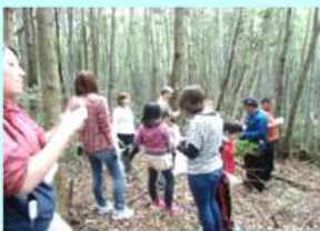
木の枝や実でアクセサリを作る

「親子植物観察・採集会」「野草の試食会」「天体観察会」 「小・中学校でのゲストティーチャー」「会員研修旅行」