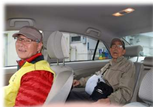
ボランティアさんと利用者さん

公共交通機関を利用できない 移動困難者の命を繋ぐ 通院移送ボランティア活動を行います。