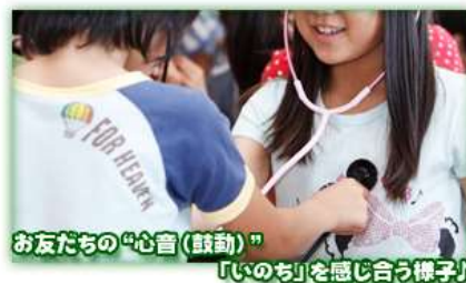
お友だちの「心言(鼓動)」 「いのち」を感じ合う様子♪

出前講座で、子どもたちに「いのちの大切さ」や「他人をゆるすことの勇気」などを伝えています。