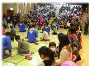
五色百人一首大会