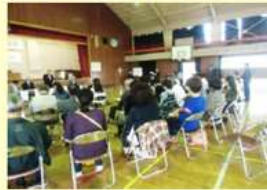
稲佐地区教育懇談会