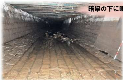
暗渠の下に眠る、石畳の銅座川