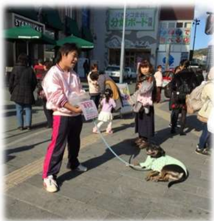
夢彩都前での活動の様子