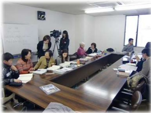
ある日のクラス風景