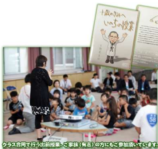
クラス合同で行う出前授業。ご家族(有志)の方にもご参加頂いています。