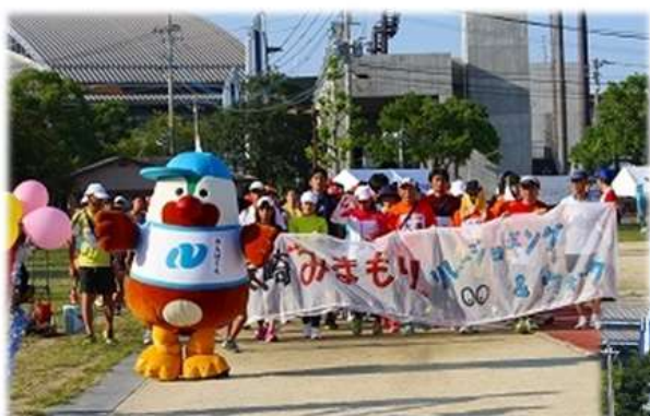
長崎“みまもり”リレージョギング&ウォーク大会の様子

大学生から高齢の方まで、幅広い層のメンバーが準備、運営に携わることで、ネットワークを広げることにもつながります。