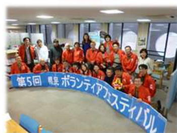
ボランティア フェスティバル

社会貢献活動 に取り組むことを通して、子どもたちのため、保護者のために役立つ事ができればと考えています。