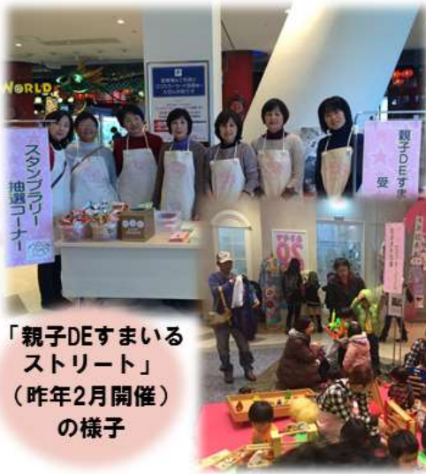
「親子DEすまいる ストリート」 (昨年2月開催) の様子

子育て支援活動を行っている グループやボランティアの方々の ネットワークを作っています。