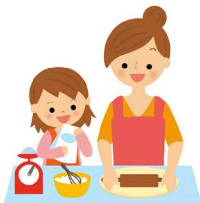
「ママン」のおやつ作り (ガトーショコラ)