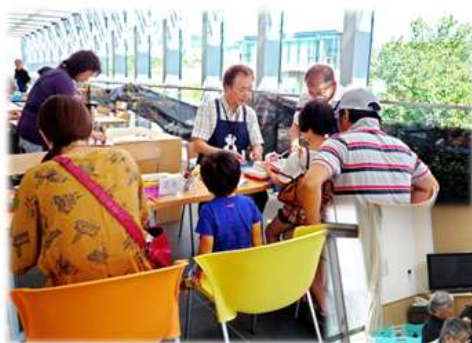
おもちゃ病院 開催時の様子