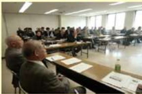
教職員対象の講話