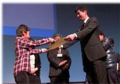
親守詩長崎県大会