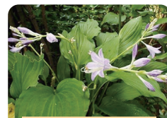
ナガサキキボウシ