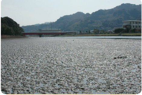
⑤ 西海川の河口干潟

シオクグ、シバナ、ウラギクなどの塩生植物やハマボウが多く見られ、蓼貝のヒメカノコやヒロクチカノコガイは県内でも有数の生息地となっている。また、クシテガニなどの希少なカニ類も生息する。一方で大村湾の干潟の保全やヨシ原の保護が必要である。