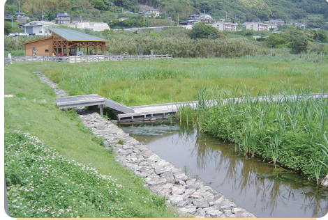
⑦ 黒崎永田湿地自然公園

カキラン、ミズトンボ、ホシクサ類などの湿地植物が市内では最も多く、昆虫類ではハッチョウトンボが確認されているが、湿地の面積が小さい。