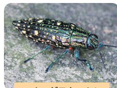
アオマダラタマムシ