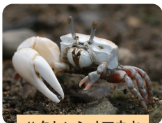
ハクセンシオマネキ

塩生植物のシオクグが多く、この汽水域に形成されている泥質干潟には、ドロアワモチなどの貝類、ハクセンシオマネキなどのカニ類、タビラクチ、トビハゼなどの魚類が生息する。