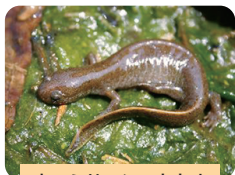
カスミサンショウウオ