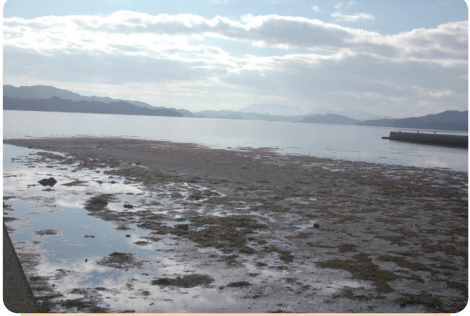
① 大江川の河口干潟

ユキガイやカガミガイ、シオヤガイなど汽水・内湾性の貝類が生息する。また、ハマグリやリシケタイラギと思われる新鮮な死殻も確認されている。