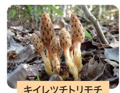
キイレツチトリモチ