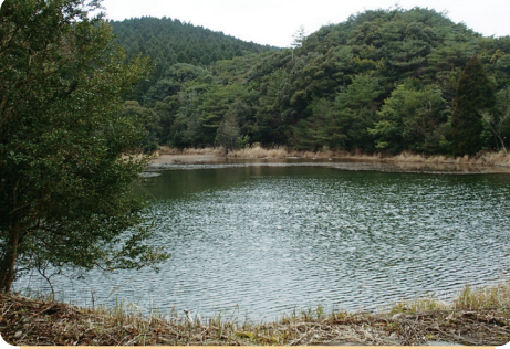
② 藤原川形上岳どぶ池

ユキガイやカガミガイ、シオヤガイなど汽水・内湾性の貝類が生息する。また、ハマグリやリシケタイラギと思われる新鮮な死殻も確認されている。