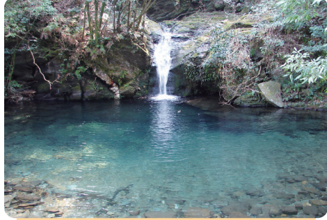
③ 県民の森（岩背戸溪谷）

この溜池には、ミミカキグサ、カキラン、ヤマドリゼンマイ、モウセンゴケなどの湿地植物や希少種のドンコ（魚類）、ハッチョウトンボが生息している。