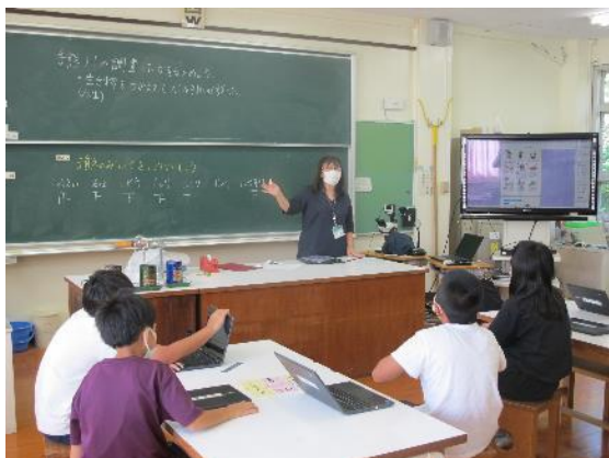
まとめ・発表の様子①