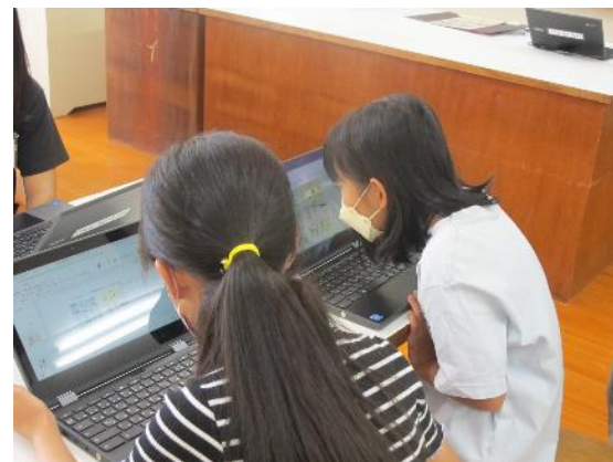
まとめ・発表の様子②