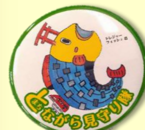
トレジャーフィッシュ君