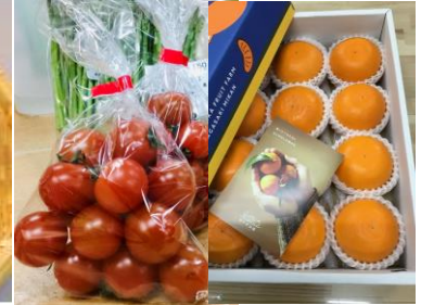
ミニトマト ・ みかん