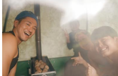
テントサウナ×キャンプ