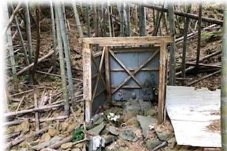
崩れかけた第59番霊場