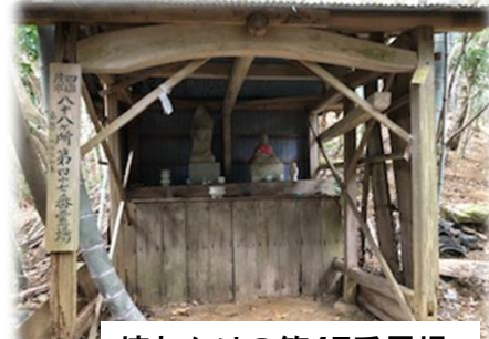
壊れかけの第47番霊場