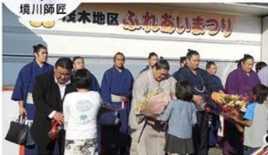
※平成27年の境川部屋力士とのふれあい会の様子