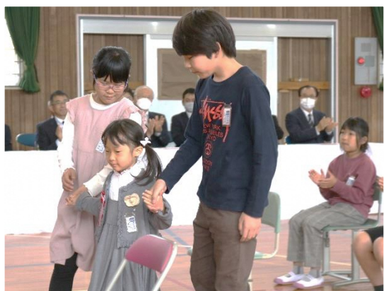
◀上級生と手をつないで入場。