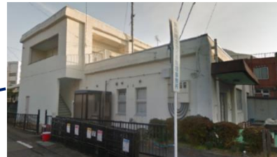
東総合事務所（東長崎土地区画整理事務所内） 地域福祉課 生活福祉係（1階） 地域整備課（2階）