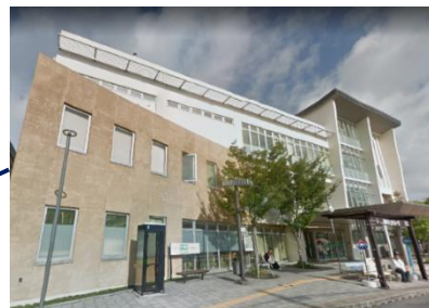
東長崎地域センター（1階） （にこにこセンター内）