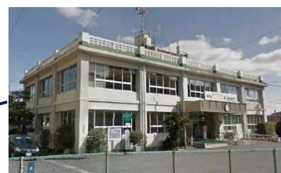
日見地域センター