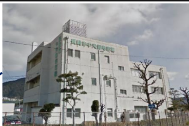
東総合事務所（長崎中央卸売場管理棟内） 地域福祉課（3階） 総務係、健康支援係