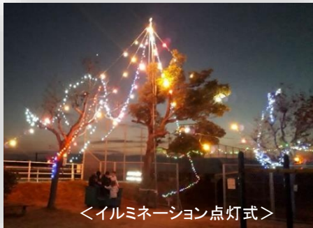
<イルミネーション点灯式>