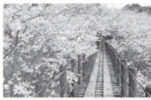
琴海中央公園吊橋