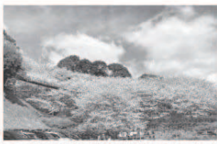
琴海中央公園駐車場から