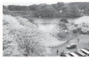
吊橋から眼下の様子

市の地域活性化事業としての「琴海花まつり」は令和3年度で終了となりますが、琴海戸根川沿いの桜は、これからも自然の美しさは変わることなく咲き誇り、ファンのかたの心を癒し楽しませくれるはず。琴海花まつり実行委員会をはじめ、これまでご支援及びご協力いただいた地域の皆様方に、この場をお借りして厚くお礼申し上げます。