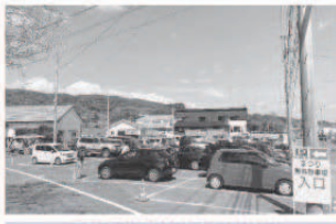
戸根公民館臨時駐車場

前日に暴風警報が発令され、開花したばかりの桜への影響が心配されましたが、午後には雨風も和らぎ天気も回復しました。翌日の日曜日には、春らしい暖かさと晴天に恵まれ、桜も一気に花開き、毎年、戸根川沿いの桜並木を楽しみにしている方々を歓迎してくれているようでした。コロナ禍のため、ライトアップや体験イベントなどが中止となりましたが、戸根公民館や琴海中央公園の駐車場がすぐに満車になるほど、たくさんのかたにご来場いただきました。駐車場整理にお手伝いいただいた戸根地区自治会及び戸根桜組のみなさん、ご協力ありがとうございました。