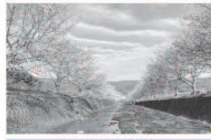
戸根川河川敷から