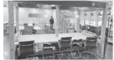
長崎駅前のコワーキングスペースミナトで開催