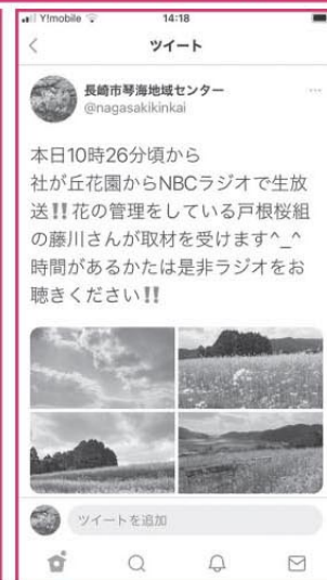
ツイッター 長崎市琴海地域センター 検索