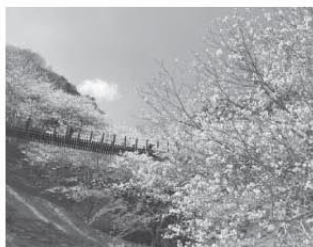
琴海中央公園吊橋

今後も引き続き、琴海地域センターのツイッター発信とWEBサイト『コトコト』で琴海の魅力をどんどん発信していきますので、ツイッターのフォローをお願いします。また、琴海地区のまちづくり協議会設立への動きなどタイムリーな地域情報や行政窓口情報も随時発信していきますので、ご期待ください。