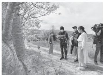
テレビ取材風景（戸根川下流）

天気の良い日に、手塩にかけて育てた花々が一気に咲いたときの感嘆。その瞬間の喜びがみんなの原動力になっています。