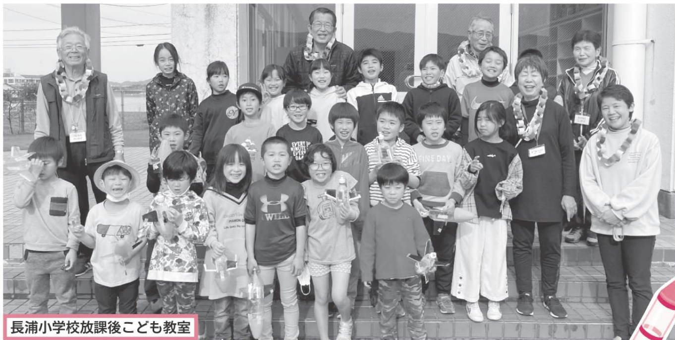
長浦小学校放課後こども教室