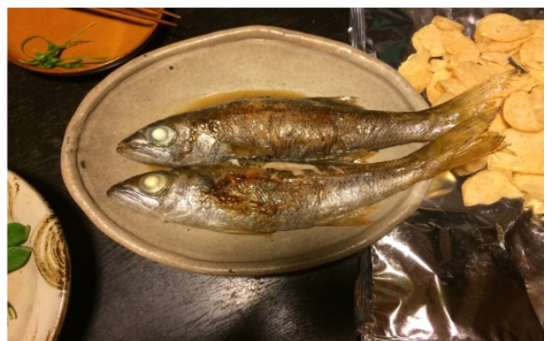
↑野母崎に来て初めて食べた野母崎産ムツ。魚介が苦手でしたが、野母崎に来てから美味しいと感じるようになりました。