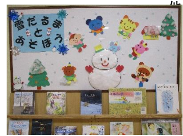
「児童コーナー」の掲示板