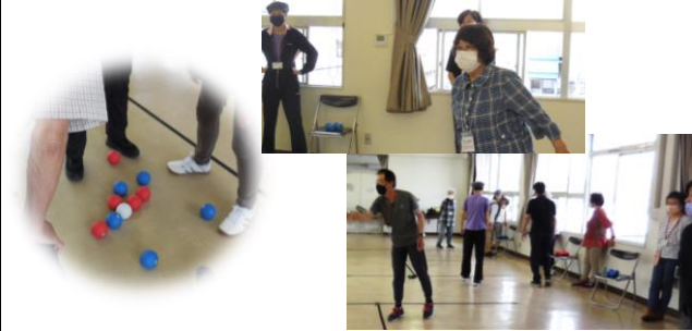
(6) リボ ッチャを楽しもう (6/21～ 全3回)