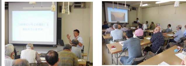
長崎は今、100年に一度のまちの変化が進行中！