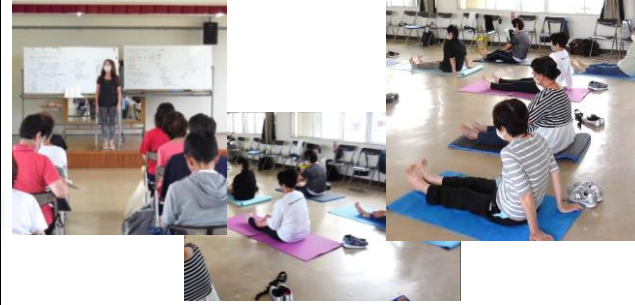
(8) やさしいヨガでHAPPYに(6/23～ 全3回)