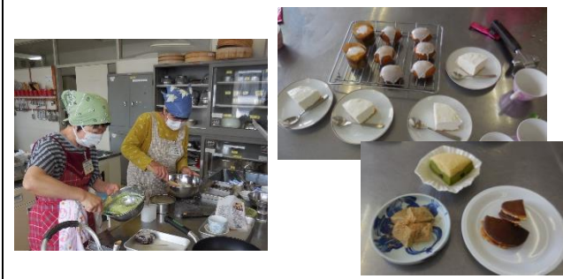
(1) 楽しいお菓子作り (5/31～ 全3回)

早いもので、6月も終わり、7月に入ろうとしています。 梅雨明けが待ち遠しいこの頃ですが、合間に訪れる晴天時は、真夏を思わせるような暑さです。皆様、熱中症などにはくれぐれも留意してお過ごしください。 さて、じめじめしたり暑かったりする毎日ではありますが、西公民館では6月も主催講座や自主成人講座、各学習グループの積極的な活動が行われ、充実した学びが展開されています。 今日は、5月末から6月に開講された講座の様子を紹介します。