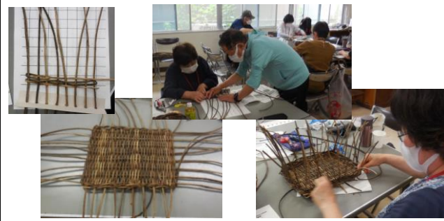
(2) つるでカゴ作り (6/13～ 全3回)