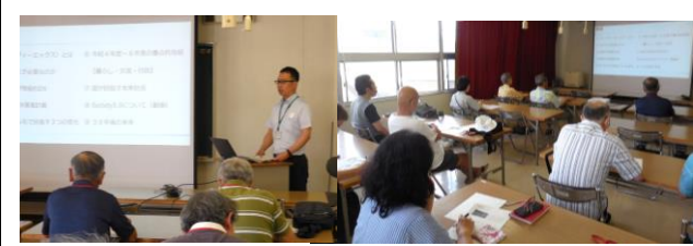
デジタルトランスフォーメーションってなあに？