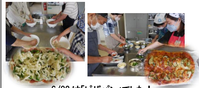
6/23は「ピザパン」でした！