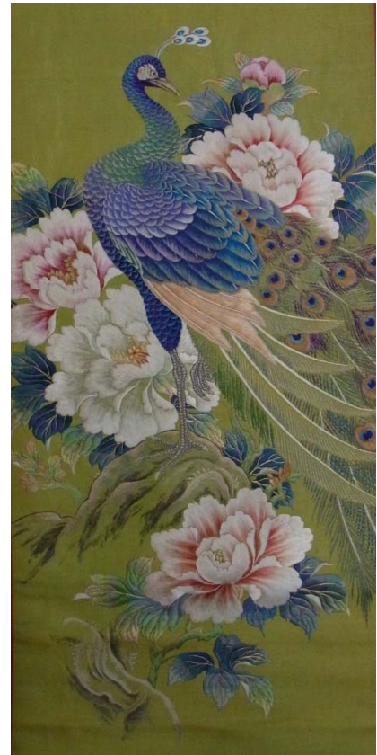
丸帯(牡丹孔雀刺繍)