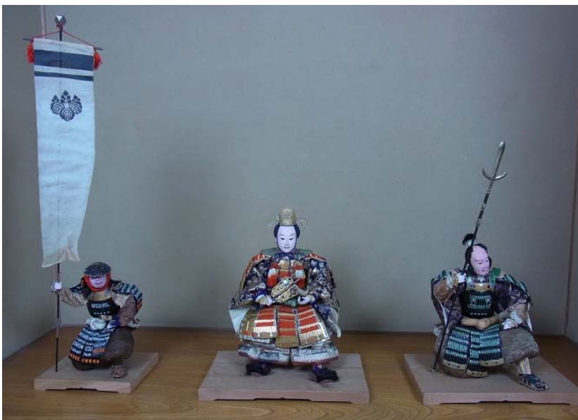
端午の節句人形(雑兵・豊臣秀吉・加藤清正) 明治34(1901)年 長崎市小川町 西家旧蔵品