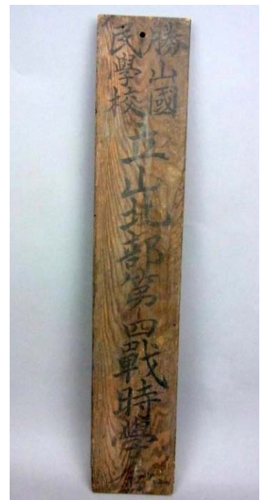
戦時中の校舎の看板 戦時中 齋藤節子様寄贈