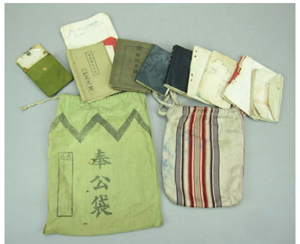
戦時関係資料 戦時中 松尾茂氏寄贈