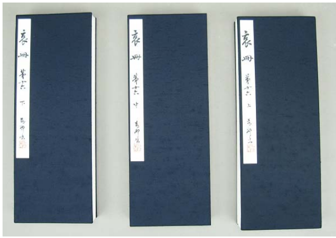
臨褚遂良・哀冊折帖