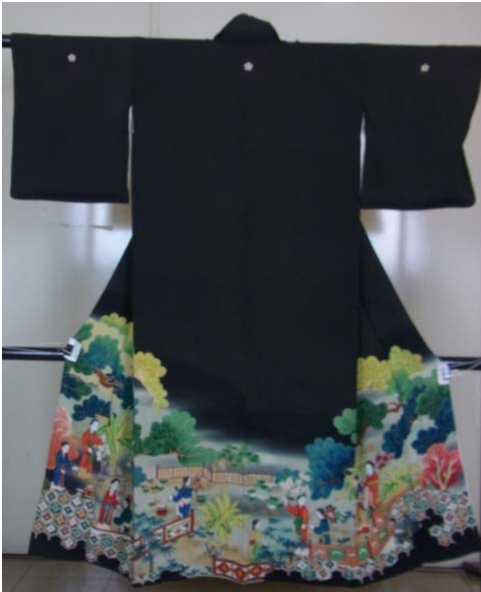
黒 留 袖