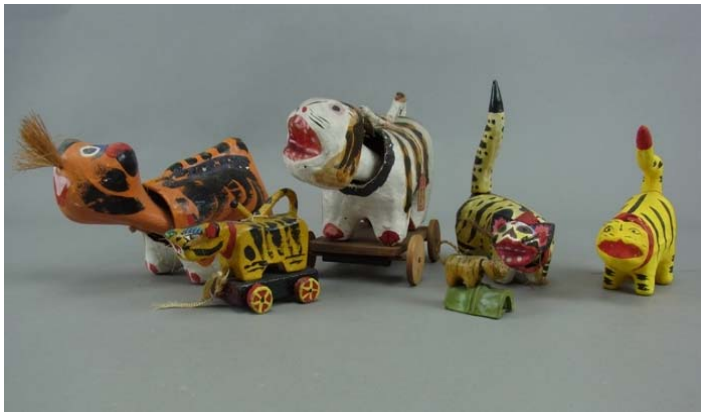
全国各地の虎の玩具