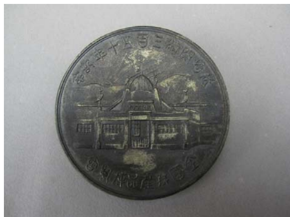
長崎開港350周年記念メダル 大正2(1913)年 古澤進氏寄贈