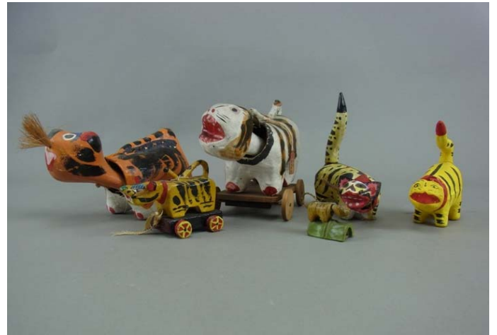
全国各地の虎の玩具 昭和時代