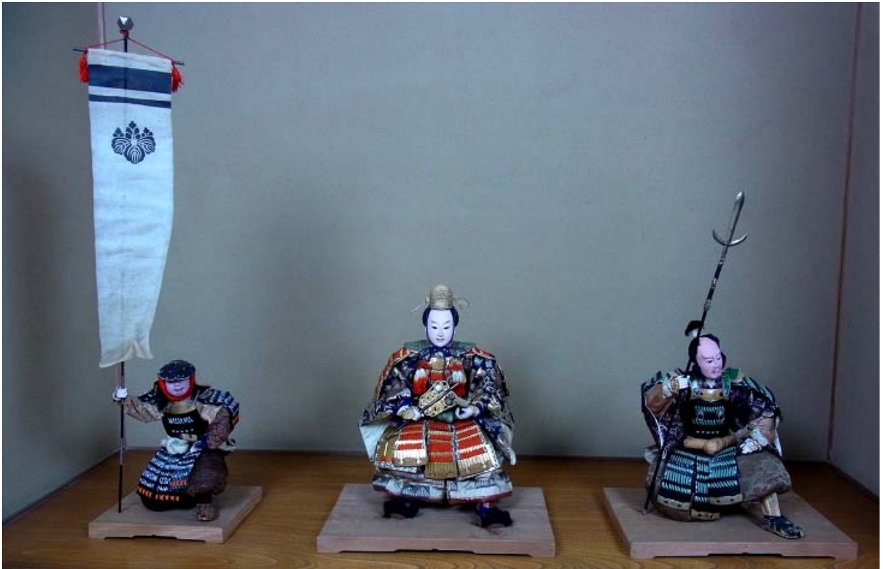
端午の節句人形 (雑兵・豊臣秀吉・加藤清正)