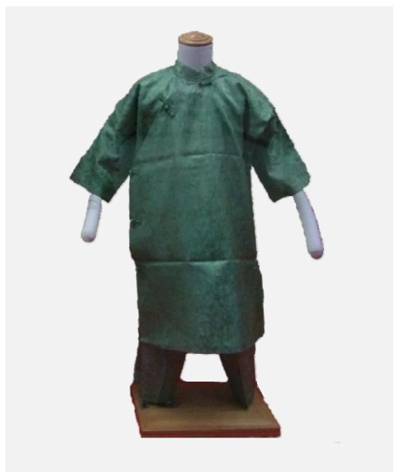
唐人船先曳衣装 昭和36(1961)年 中川雅夫氏寄贈