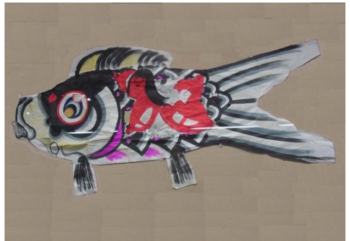
大竹の鯉のぼり (広島市) 昭和時代