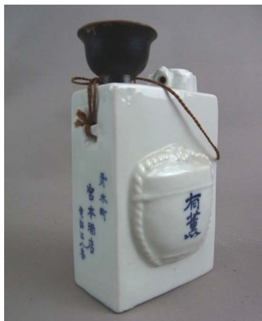
携帯用酒徳利 (宮本酒店) 昭和時代 宮本忠彦氏寄贈