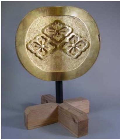
三ツ花菱金定紋馬印 慶応2(1866)年