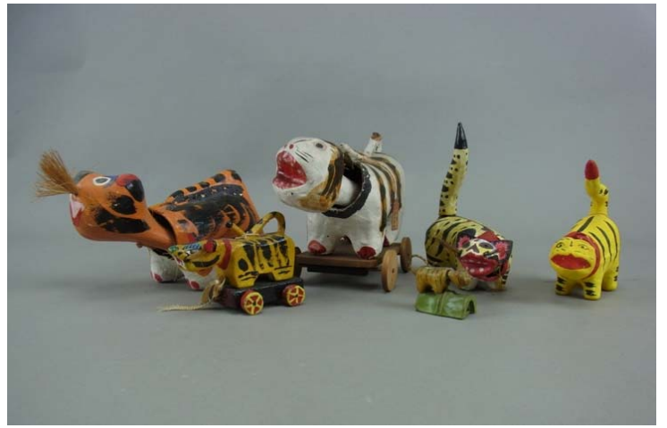
全国各地の虎の玩具 昭和時代