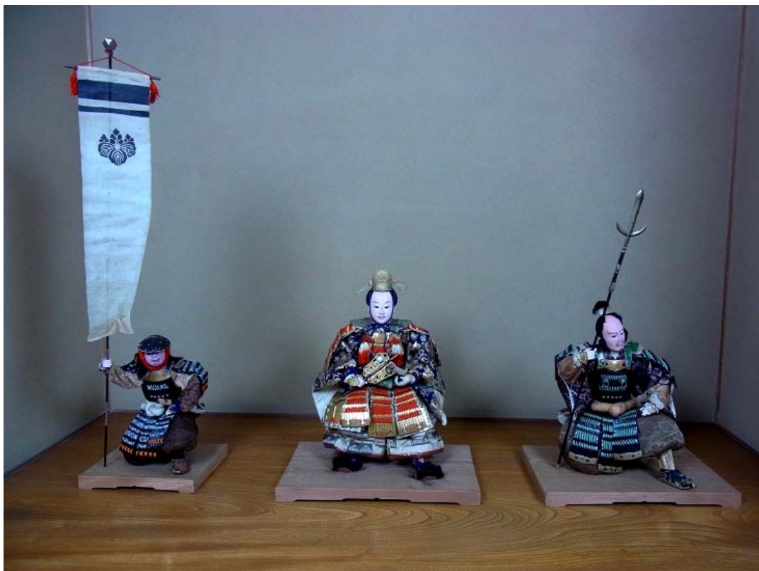
端午の節句人形 (雑兵・豊臣秀吉・加藤清正) 明治 34 (1901) 年 長崎市小川町西家旧蔵品