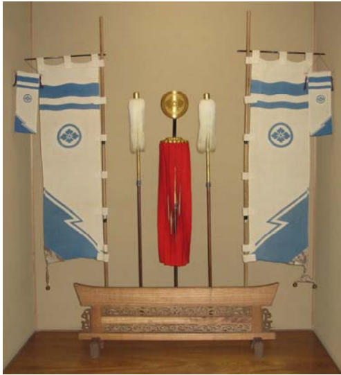
高松家の丸二花菱紋の幟 大正 13 (1924) 年