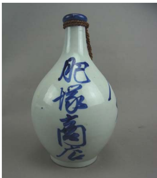
酒徳利 (肥塚商店) 昭和時代 古賀敏之氏寄贈