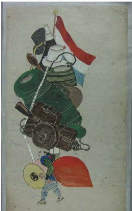
勝山町諏訪御神事踊指物絵 弘化二年(一八四五年)