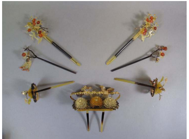
婚礼髪飾一式 大正8年(1919年)頃 西隆義氏寄贈