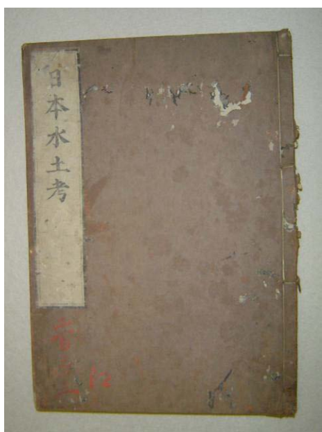
日本水土考(西川如見著) 享保五年(一七二〇年) 田中アサ子氏寄贈