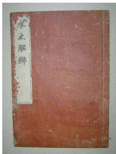
水土解辨(西川如見著) 江戸時代中期 田中アサ子氏寄贈