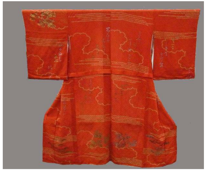
婚礼衣装袷長襦袢 大正8年(1919年)頃 西隆義氏寄贈