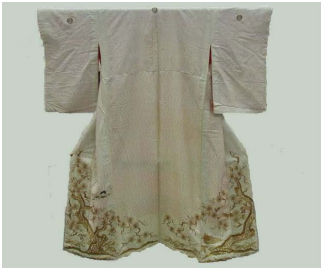
婚礼衣装打掛 大正8年(1919年)頃 西隆義氏寄贈