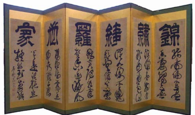
林道栄筆 六曲一双屏風(右隻)