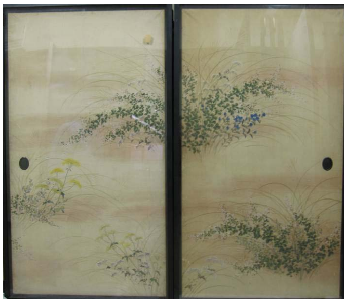
木下逸雲筆 山水図・秋草図襖