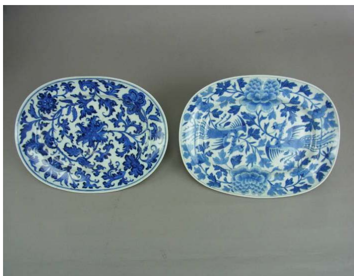
清華唐草・鳳凰文皿(中国) 18世紀後期 村上圭司氏寄贈