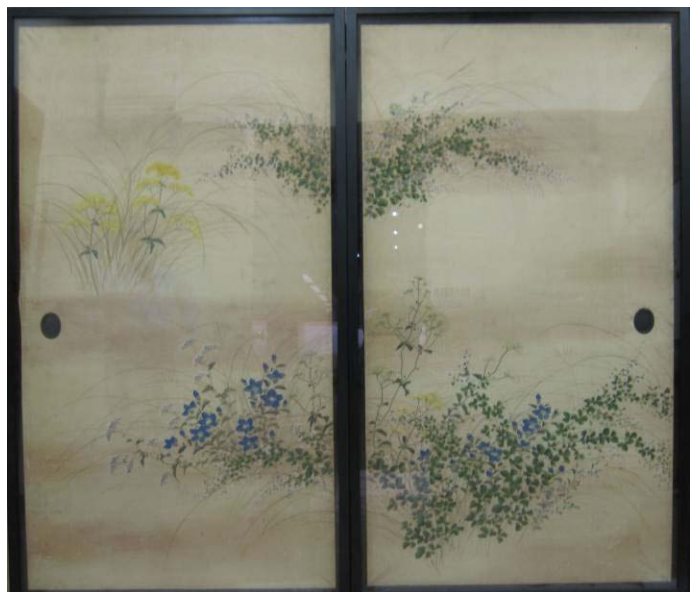
弘化元年(1844年) 山口貞一郎氏寄贈