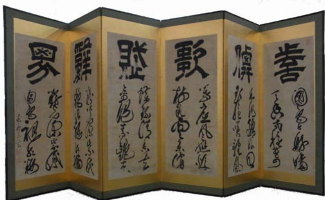
林道栄筆 六曲一双屏風(左隻)