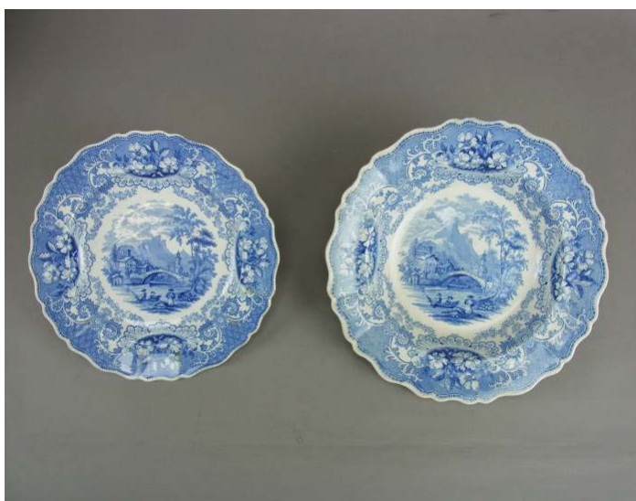
藍色西洋風景図皿(イギリス) 19世紀前期 村上圭司氏寄贈