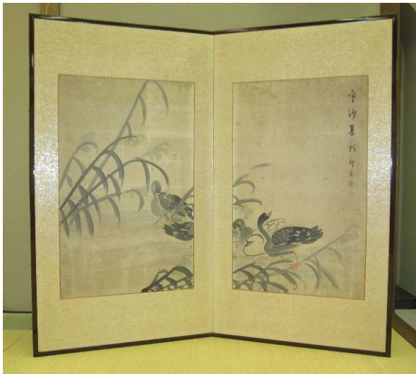
池島邨泉筆蘆雁図屏風 明治中期 大和屋隆喜氏寄贈