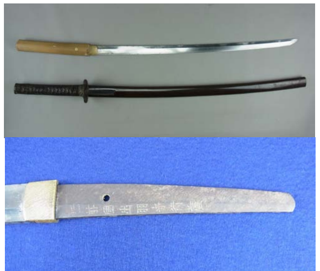
日本刀(肥前国出羽之守行廣作) 約350年前の作 川副忠子氏寄贈