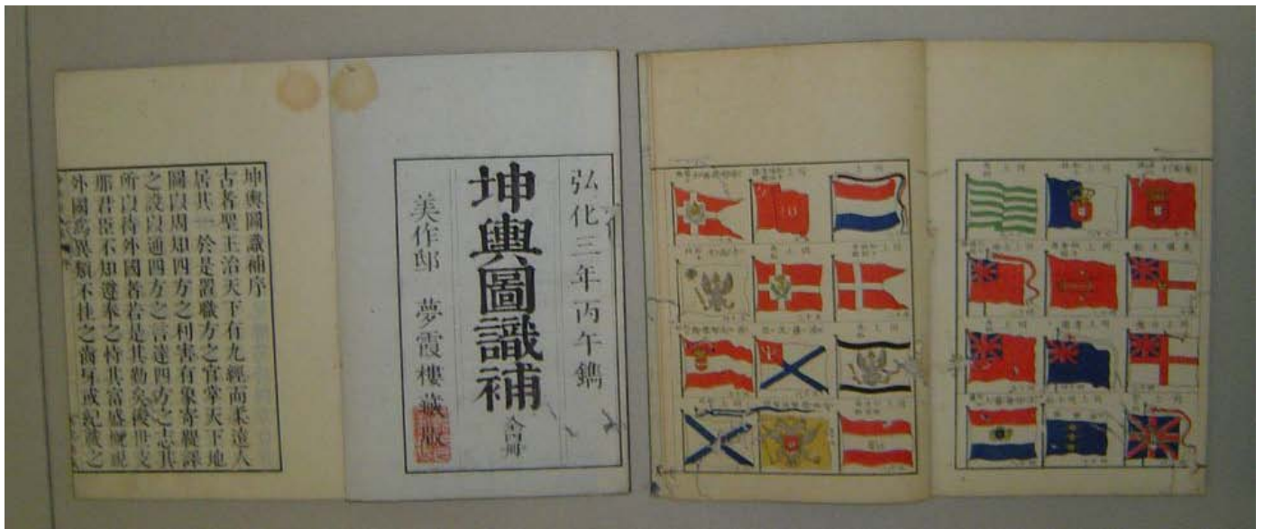
坤輿圖識 箕作省吾編 弘化4年(1847年)