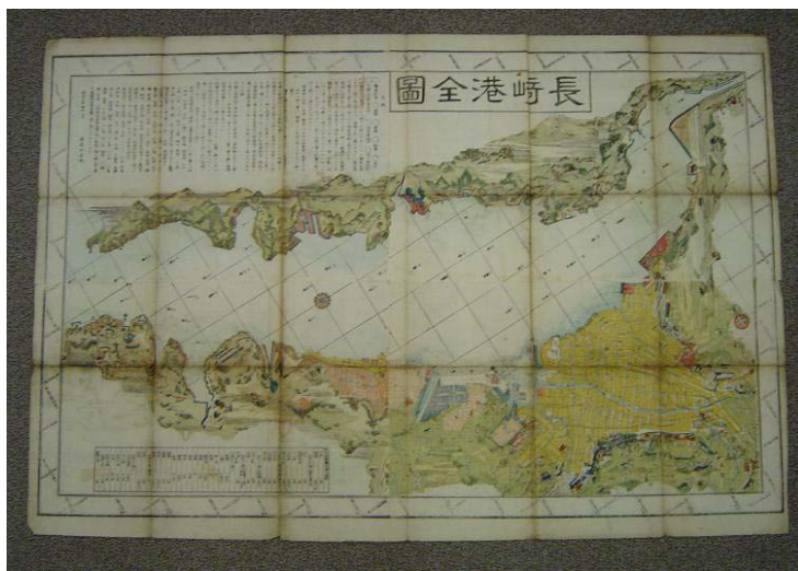
長崎港全図 明治3年(1870年) 田中アサ子氏寄贈