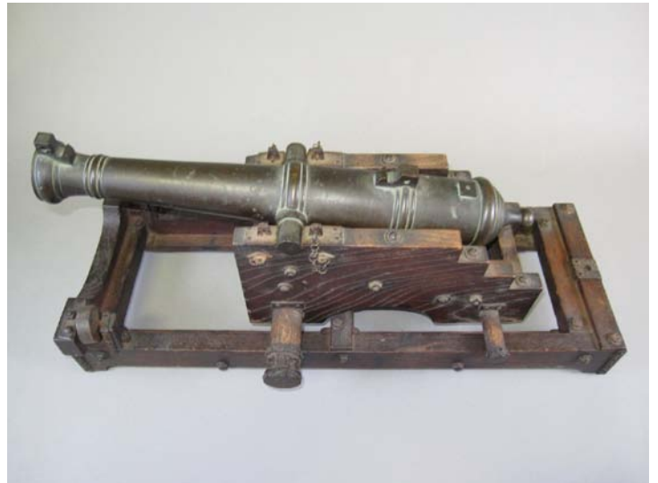
青銅製大砲雛型 江戸時代後期 遠藤ナツ氏寄贈