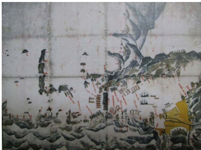
異国船御固緒家備之図 江戸後期 若杉茂昌氏寄贈