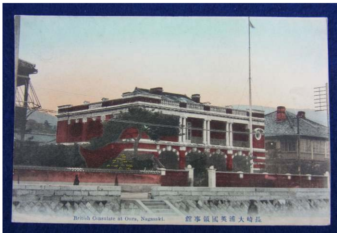
長崎大浦英國領事館

明治41(1908)年、英国人技師の設計で、レンガ造りの英国領事館が建てられました。平成2(1990)年、国指定重要文化財となりました。