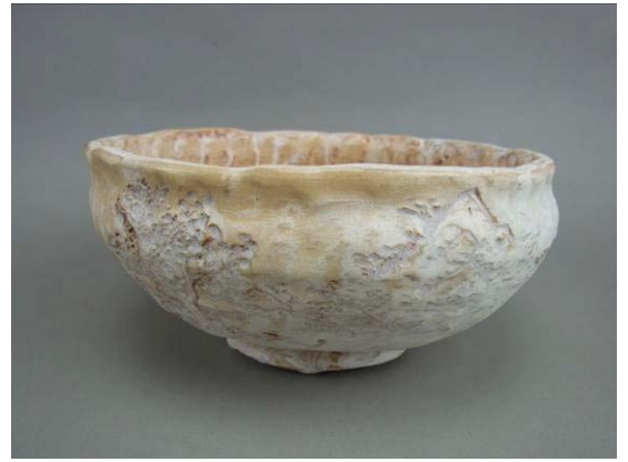
山里焼 菓子鉢(馬淵龍石作)

展示品 林道栄筆 六曲一双屏風・西洋皿・愛宕焼・山里焼・学業證書・長崎の絵葉書・初節句飾り幟・加藤清正、豊臣秀吉、雑兵の節句人形など 100点