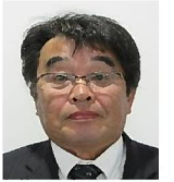
岩永、一也 神浦、出津、黒崎地区 他