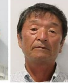
田中、幹生 琴海形上、琴海戸根原地区