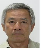
三浦、信男 黒浜、高浜、野母地区 他