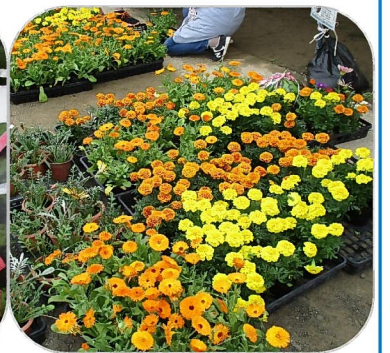
主に地元の方で育てた花苗です