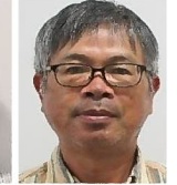
久保、正 琴海形上、長浦地区