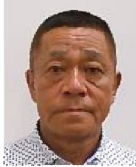
今村、秀喜 琴海尾戸、琴海大平地区