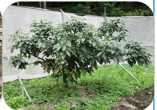
農業センターの圃場にあるアボカドの木