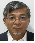
柴原、恵 黒浜、野母、脇岬地区 他