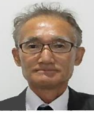
森保、欣也 為石、宮崎、川原地区 他