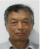
松本、貞幸 蚊焼、香焼、高島地区 他