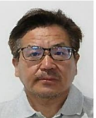
松浦、行信 宮崎、脇岬地区