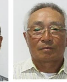
濱口、雅洋 琴海戸根、琴海村松地区