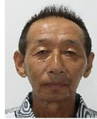
川添、孝則 琴海戸根、西海地区