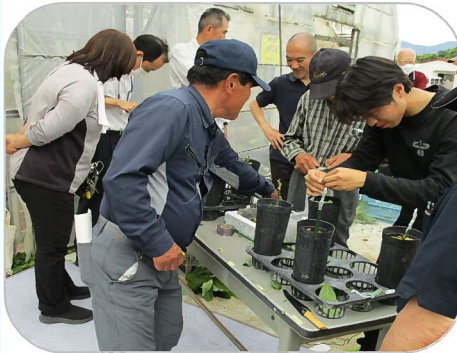
細心の注意を払って作業を行います

6月5日にピワ等の補完作物や、これからの新規作物として期待されるアボカドの接ぎ木の講習会があり、農家の方が熱心に講習を受けていました。