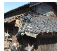
緊急代執行を要する 崩落しかけた屋根