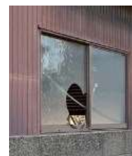
窓が割れた 管理不全空家